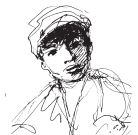
VRH Celle gGmbH