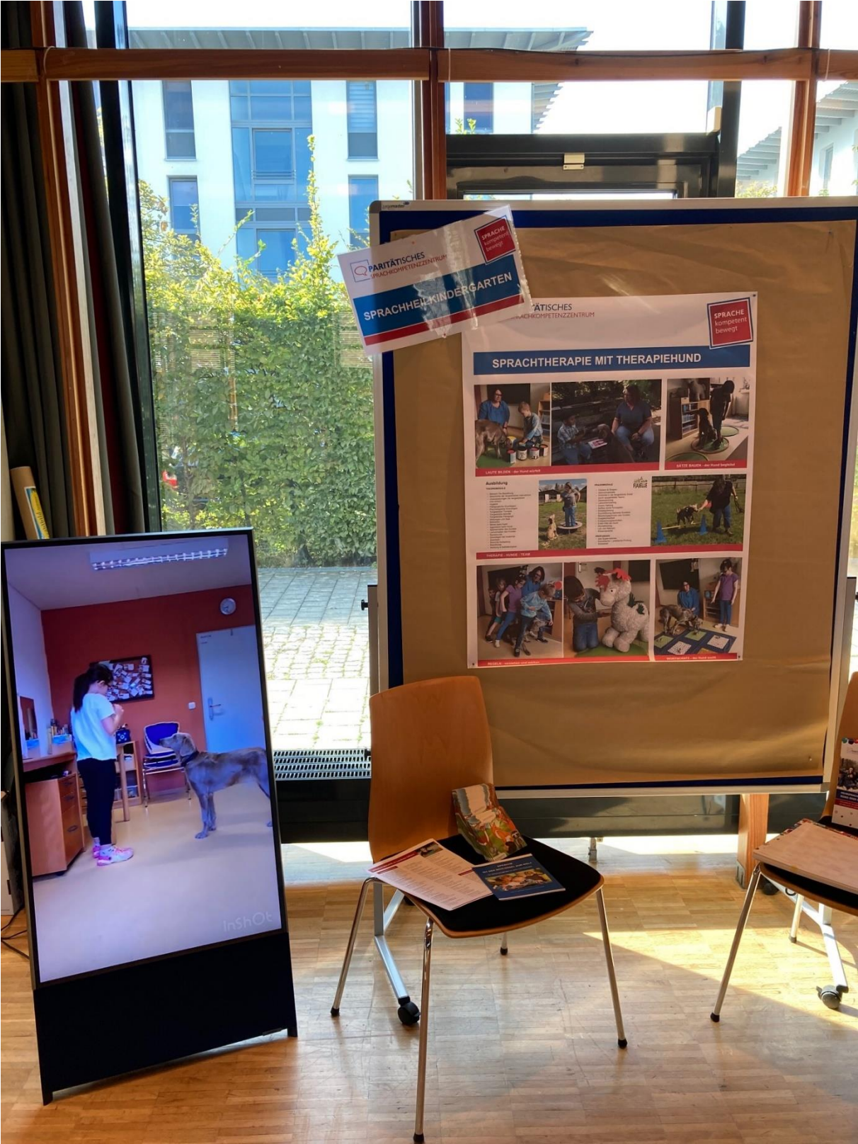
Sprachheilkindergarten Pustebume (SHG Gifhorn)