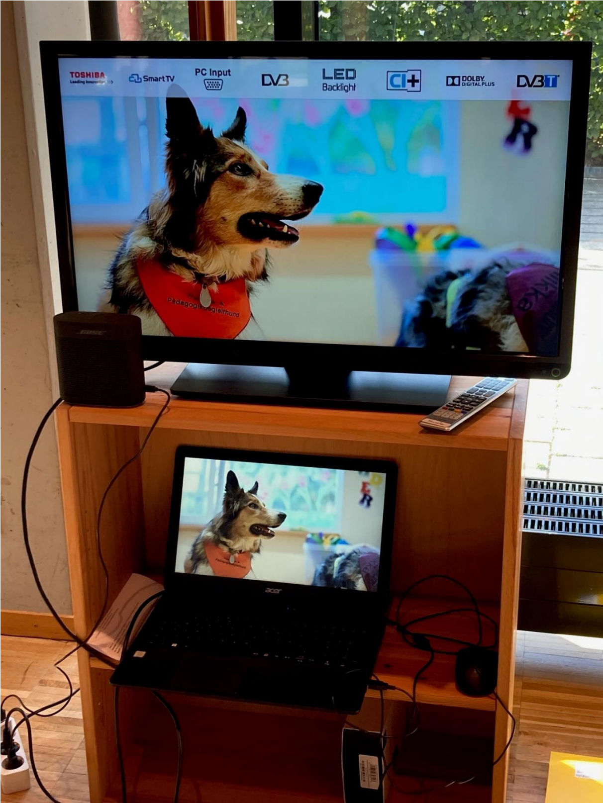
Diverse Image-Filme einzelner Sprachheilkindergärten